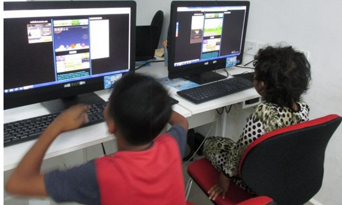
Latihan menggunakan mouse menggunakan minimouse.us