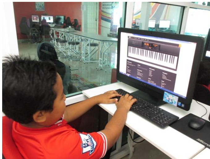
Latihan Keyboard menggunakan piano virtual

Photo caption names Keterangan gambar berserta nama