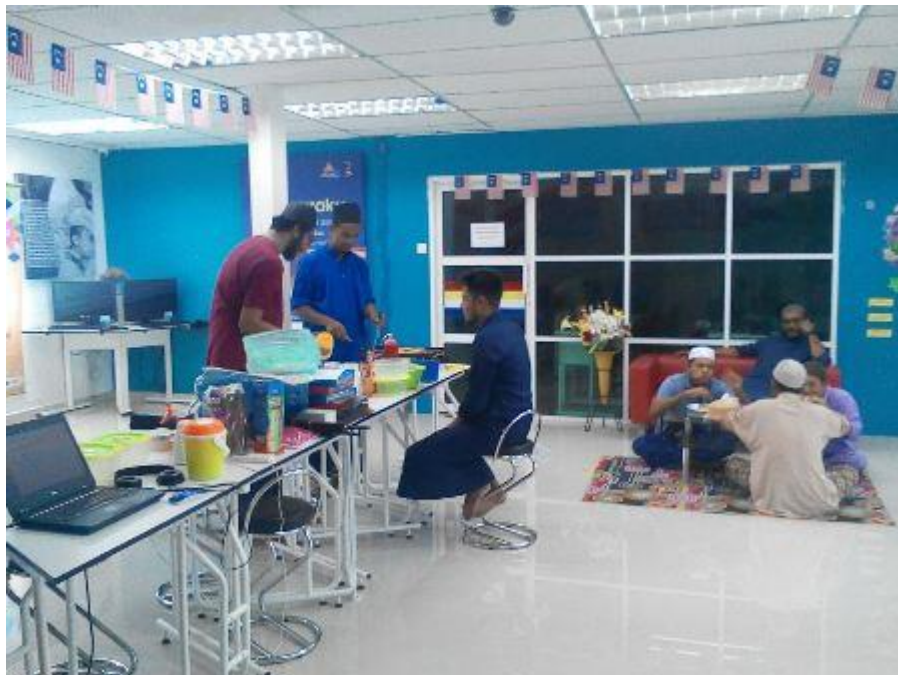
Sesi penyediaan makanan