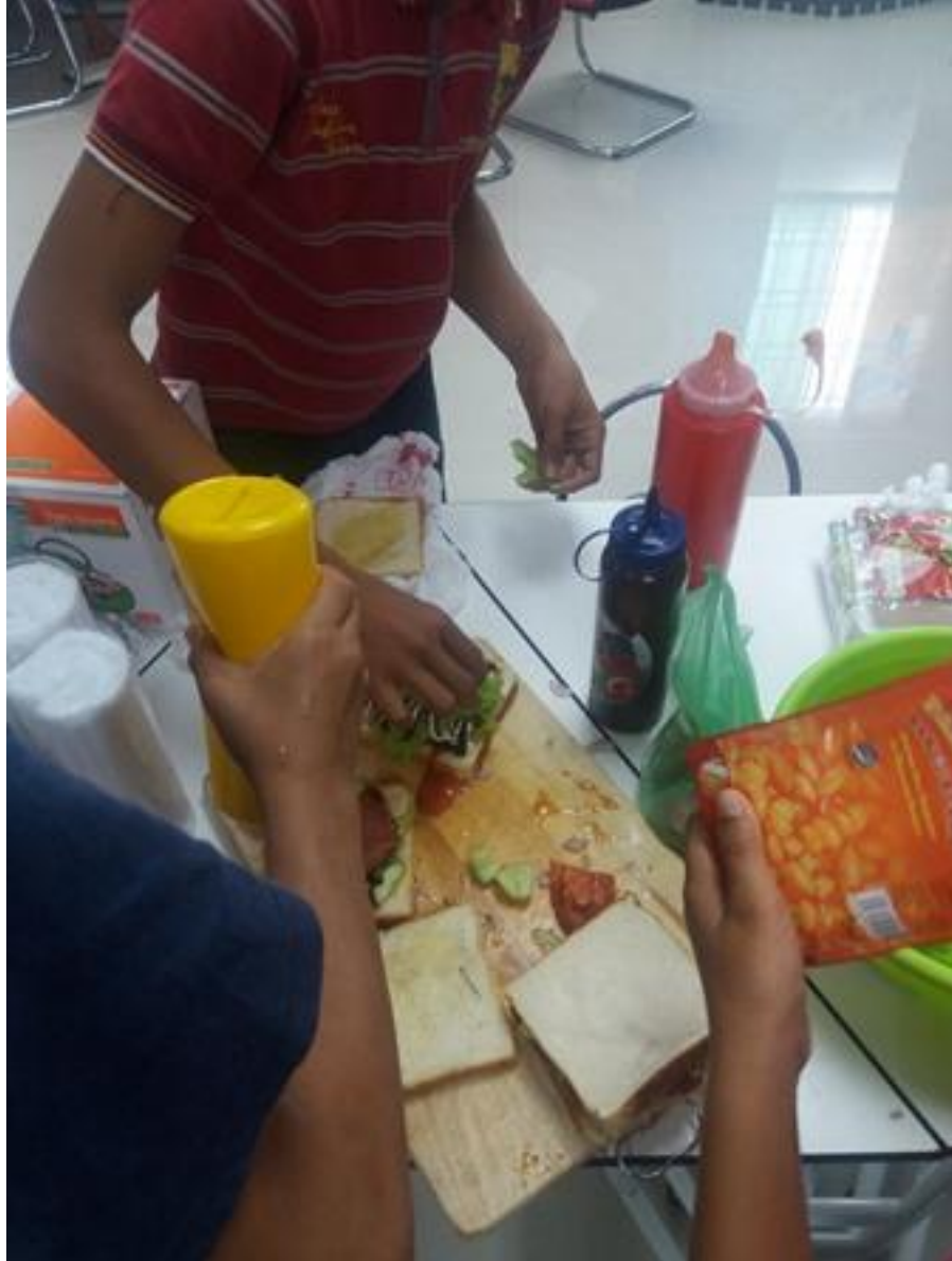
Penyediaan burger kategori kanak-kanak