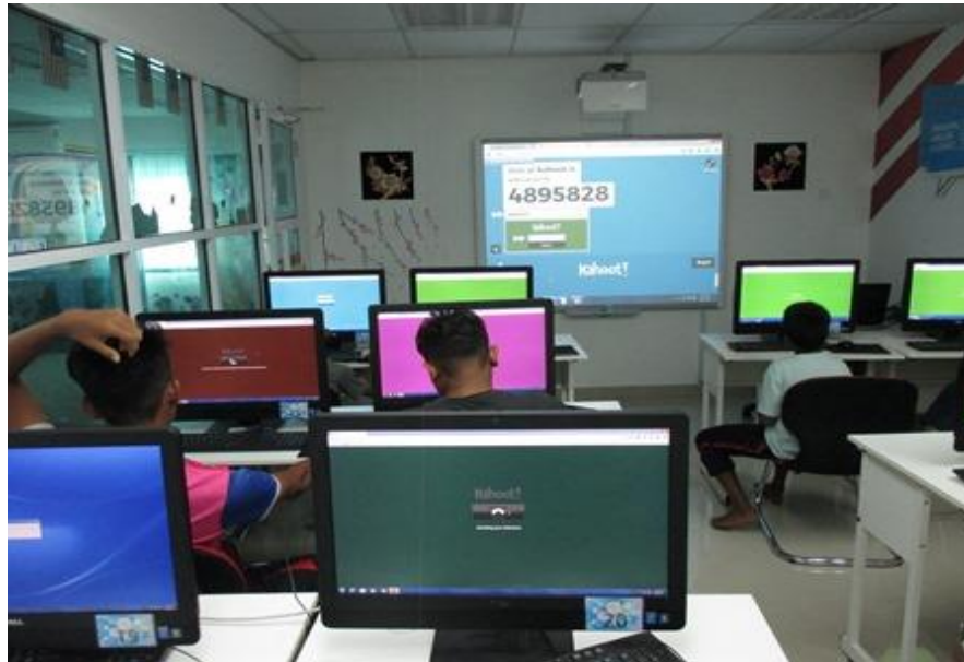
Pelajar menjawab soalan di Kahoot.it