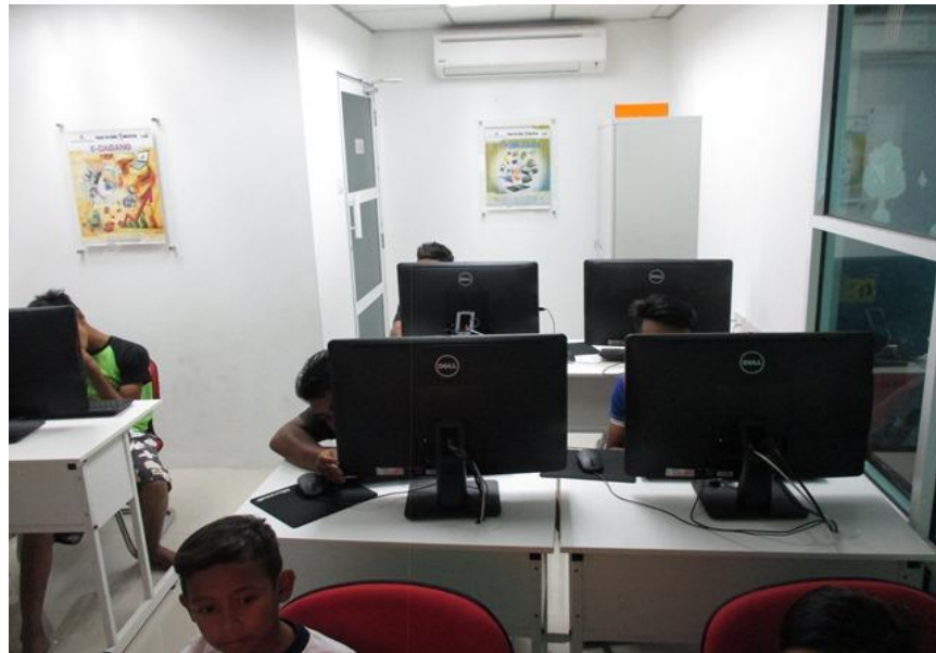
Pelajar mendengar taklimat Klik dengam Bijak dan taklimat ringkas Dashboard Komuniti