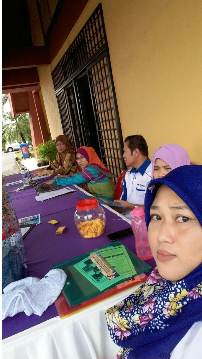
Kaunter Pendaftaran Peserta