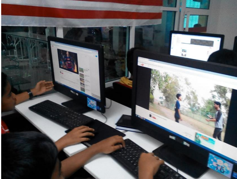
Belajar bagaimana untuk melayari Youtube