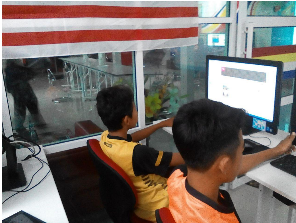
Pelajar diajar bagaimana untuk mmbuat Channel di dalam Youtube.