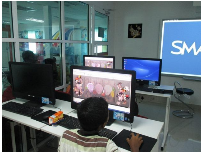
Pertandingan puzzle pusingan kedua