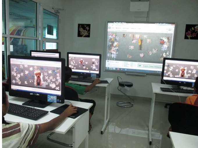
Dalam proses menyiapkan puzzle pusingan pertama